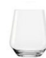
358 00 16 Whiskybecher D.O.F. Whisky Tumbler D.O.F. 470 ml / 16 oz H: 108,5 mm / 4¼" Ø 91,5 mm / 3½"