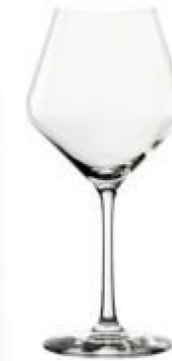
377 00 00 Burgunderkelch Burgundy 545 ml / 18¾ oz H: 220 mm / 8½" Ø 107 mm / 4¼"