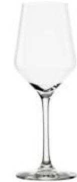
377 00 02 Weißweinkelch White Wine 365 ml / 12¼ oz H: 220 mm / 8½" Ø 82 mm / 3¼"