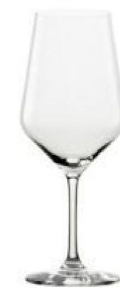
377 00 35 Bordeauxkelch Bordeaux 650 ml / 22 oz H: 240 mm / 9½" Ø 98,5 mm / 3¾"