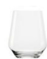
358 00 15 Whiskybecher O.F. Whisky Tumbler O.F. 370 ml / 12½ oz H: 100 mm / 4" Ø 85 mm / 3½"