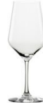
377 00 01 Rotweinkelch Red Wine 490 ml / 16½ oz H: 225 mm / 9" Ø 90 mm / 3½"